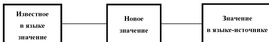
Рис. 2. Сопоставление семантики слов для различения вторичных заимствований и семантических внутриязыковых преобразований.

На основании высказанных Л.П. Крысиным положений и примеров можно предложить следующую методику разграничения слов-продуктов семантических преобразований и вторичных заимствований. Известное в языке значение сопоставляется с новым значением с целью определения наличия семантических преобразований на основе развития основной или дополнительных сем, а затем – со значением в предполагаемом языке-источнике. Для большей наглядности порядок сопоставления показан на схеме.